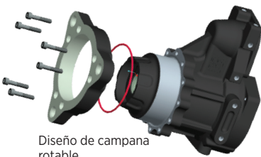
Diseño de campana rotatable